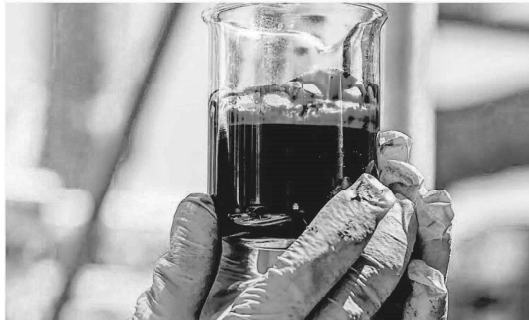
O Estado do Rio de Janeiro é o maior beneficiário da receita, destino de 85% da arrecadação destinada a governos estaduais.

O texto estabelece que Estados e municípios não produtores passem a ter direito a 49% da arrecadação